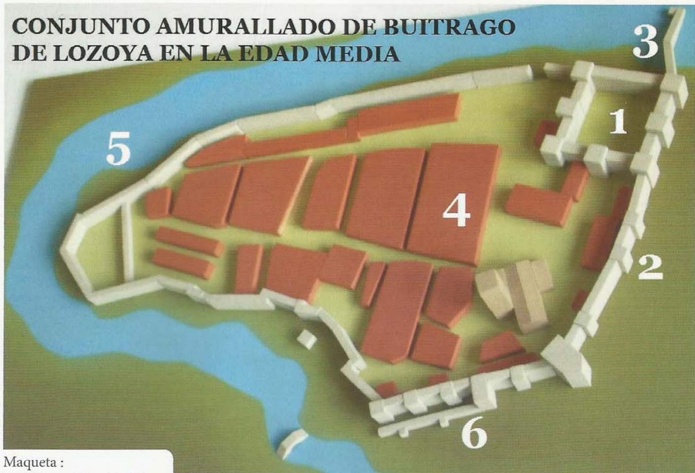
Maqueta : José Manuel Encinas Plaza