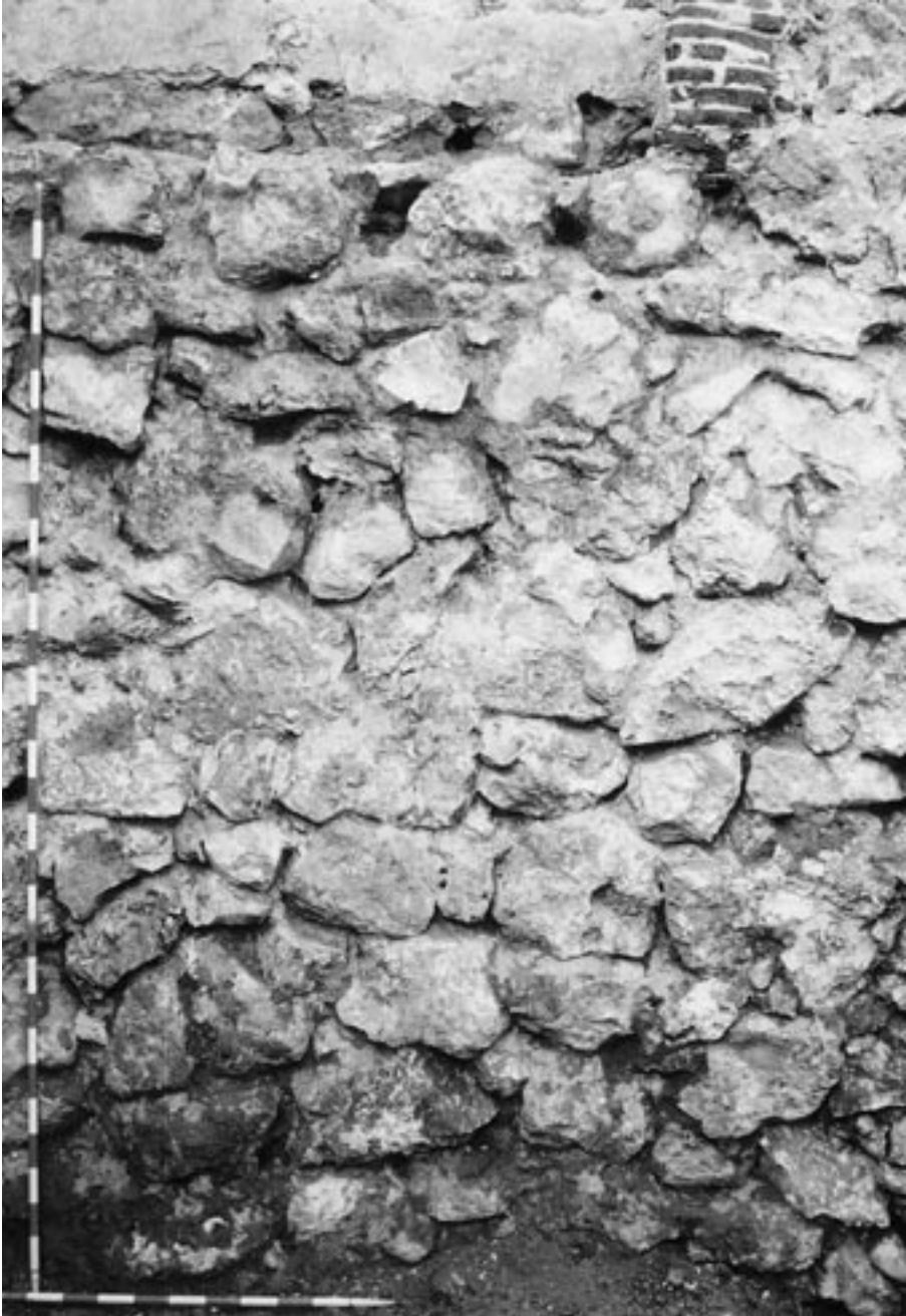
FIG. 5. Detalle del aparejo de la muralla islámica.