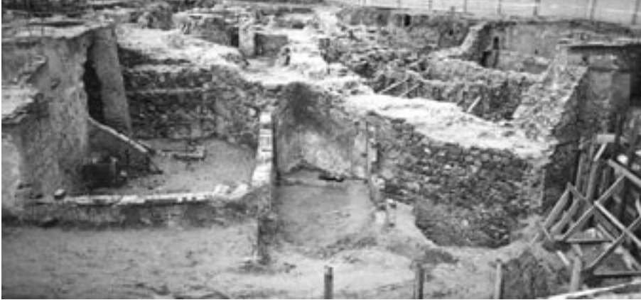
FIG. 3. Aspecto general de la excavación de la plaza de la Armería. En primer término la muralla islámica. En el interior del recinto se pueden ver las casas y calles de la ciudad medieval.