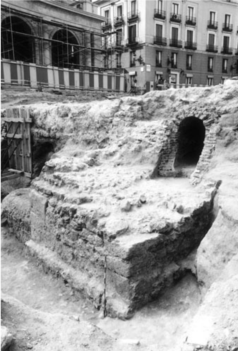
FIG. 2. Cimentación de la atalaya islámica (excavaciones de la plaza de Oriente).