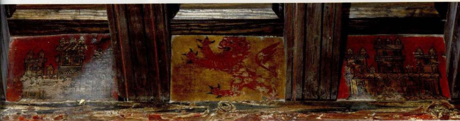
Restos de policromía medieval realizada al temple en la estructura de madera del coro. Los motivos que más se repiten son castillos amarillos sobre fondo rojo y leones rojos sobre fondo amarillo.

JUNTO A LA ENTRADA DEL VIEJO CEMENTERIO DE CARABANCHEL, A ESPALDAS DEL SOLAR EN EL QUE SE ALZÓ HASTA 2008 LA POLÉMICA PRISIÓN PROVINCIAL, NUESTRA VILLA CONSERVA, CASI A ESCONDIDAS, EL ÚNICO EDIFICIO DE LA COMUNIDAD MADRILEÑA QUE MANTIENE PRÁCTICAMENTE INTACTA LA ARQUITECTURA MUDÉJAR EN QUE FUE CONSTRUIDO A COMIENZOS DEL SIGLO XIII